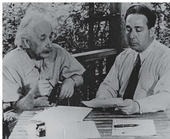
图3 爱因斯坦(左)和齐拉(右)

美国总统罗斯福的科学顾问万瓦尼尔·布什(Vannevar Bush, 1890~1974)曾向爱因斯坦请教过一