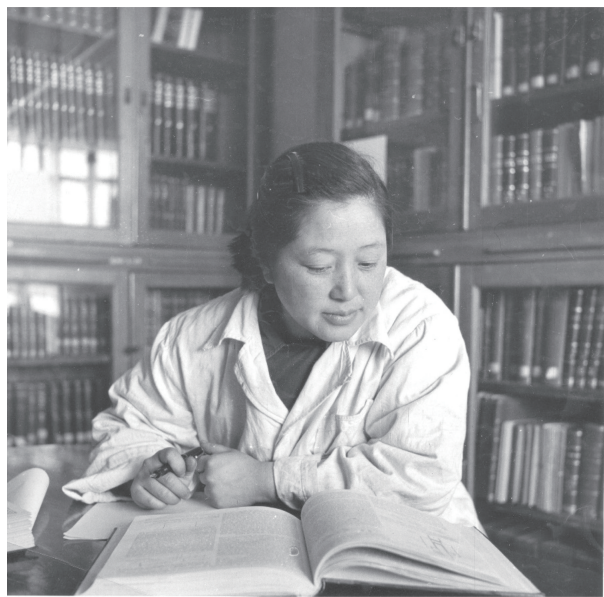
图4 1957年在401所图书馆(得1956年自然科学奖金三等奖后)

可以借鉴试试。”这就为提高灵敏度问题指明了方向。1957年,新型核乳胶可以记录电子径迹,经过反复改进,终于制成电子径迹更为明显的核5乳胶,达到国外同类产品水平。