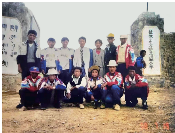
图1 1994年建成的“扯休乡文裕希望小学”

西藏青基金会接到通知后即与相关部门商议,最终选定萨迦县扯休乡的乃村作为这座“希望小学”的校址。乃村距离县城103公里,平均海拔高度将近3900米,自然条件较差,群众生活较为艰苦。当时该村虽然有一个教学点,但既没有像样的教室,也没有课桌椅,适龄儿童入学率非常低,老师和学生加在一起不过10多人。当地藏胞得知要在村中建设正规学校,子女能够就近入学而欢欣鼓舞,积极响应乡政府号召,主动为建校投入850多个人工,校舍在短时间内便顺利竣工。