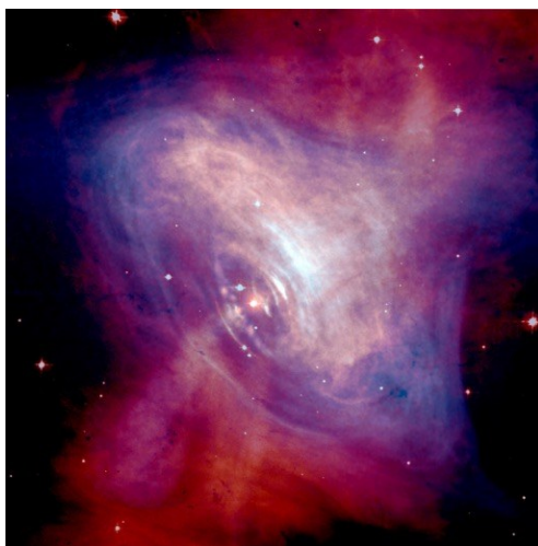
图3 蟹状星云的复合影像,其中红色部分为哈勃太空望远镜拍摄的光学波段像,蓝色部分为Chandra天文台拍摄的X射线波段像

相信在不远的将来,尤其是在高能天体物理领域,蟹状星云将继续为我们揭开宇宙的奥秘贡献力量。