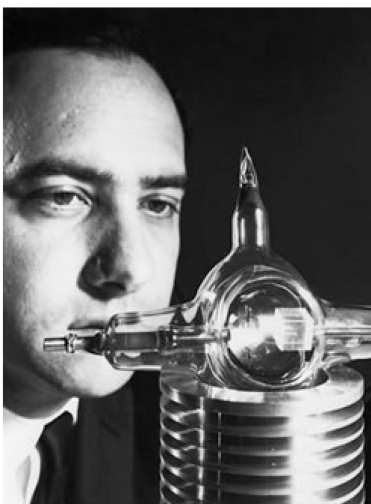
梅曼凝视着立方状的红宝石晶体沉思

激光器的理论基础架构在当时已被提出多年。爱因斯坦于1917年的论文中提出受激发射的可能性，但直到20世纪40和50