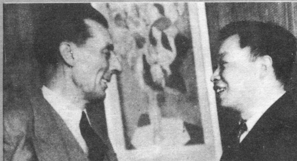
↑与约里奥-居里在维也纳世界和平大会上（1952）