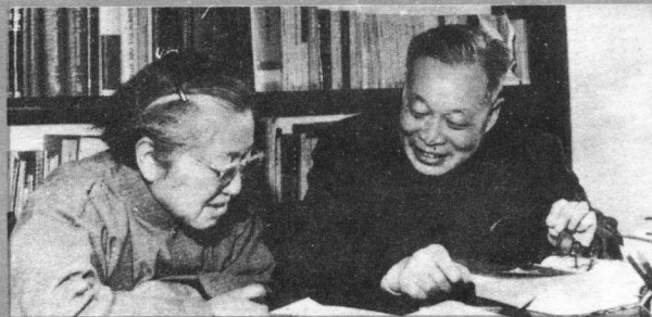
↑与何泽慧讨论《原子能发现史话》（1973.2）