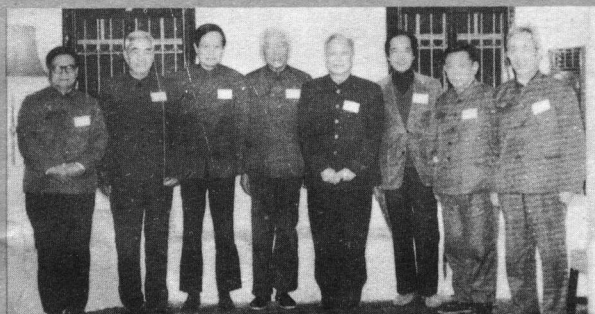
↑钱三强（左5）参加广州基本粒子会议时留影（1980年初）