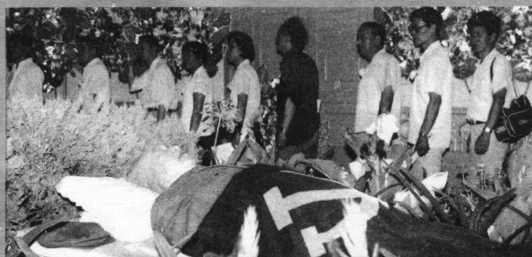
←科技界人士含悲送钱公（1992.7.4）