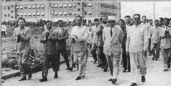
↑与周恩来等陪同外宾参观原子能所