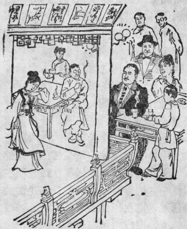
2 爱因斯坦夫妇在欢迎代表的陪同下,在“一品香”餐厅品尝了中餐,然后去“小世界”听昆剧。