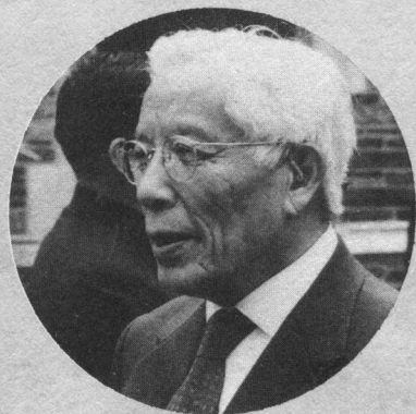
↑周培源教授荣获普林斯顿名誉法学博士学位时留影（1980年6月）