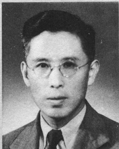
↑40年代的周培源教授