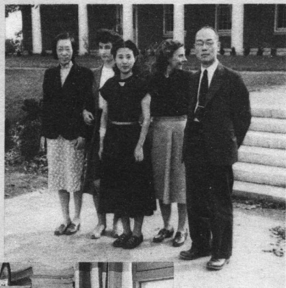
与诺贝尔物理奖获得者 汤川秀树 (右1) 及其夫人 (右3) 合影 (1948, 美国)