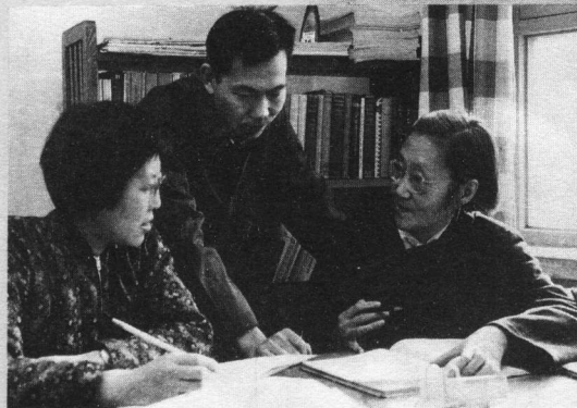
与科研人员在一起 (1972)

中国著名的物理学家王承书教授, 湖北人, 1912年出生, 1934年毕业于燕京大学物理系, 后留校任助教, 并获“斐托斐”金钥匙奖. 1938年到湖南湘雅医学院, 任讲师. 1941年获巴尔博奖金赴美求学. 1944年获博士学位后在美国密执安大学、普林斯顿高级研究所工作. 在研究稀薄气体的输运问题时, 发现了对于麦克斯韦气体线性化的玻尔兹曼积分算符的本征函数及相应的本征值. 此结果对从事这一领域研究工作的人有参考价值. 她在统计物理方面做了大量工作, 所得结果多被收入乌仑贝克等编的一套统计物理书中. 1955年冲破阻力回国, 被任命为近代物理研究所理论室副主任, 从事受控核聚变反应及等离子体物理方面的研究工作. 1961年开始研究铀同位素分离, 参加我国第一座铀同位素分离厂的建立, 指导级联静态、动态的理论计算工作, 为研制我国第一颗原子弹作出贡献. 1964年担任大型扩散机总设计师, 1975年参加并领导气体离心法分离铀同位素研究工作, 同时提出激光分离铀同位素的建议; 1978年调任核工业部科技局任总工程师, 兼任清华大学教授, 在确定研究方向、进行学术交流、培养科研人材方面作出了出色的成绩.